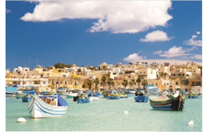
Malerisches Fischerdorf Marsaxlokk

In der Paulusbucht sehen wir die Kirche „ St.-Pauls-Schiffbruch “. Mit einem Luzzu-Boot erreichen wir die St.-Pauls-Inseln, den Ort des Schiffbruchs. In Mosta beeindruckt uns der Dom mit einer der größten Kirchenkuppeln weltweit. Anschließend erhalten wir bei einem Besuch von Malta Sunripe Einblick in die maltesische Landwirtschaft und dürfen, begleitet vom Hauswein, frische, handverlesene Produkte verkosten.